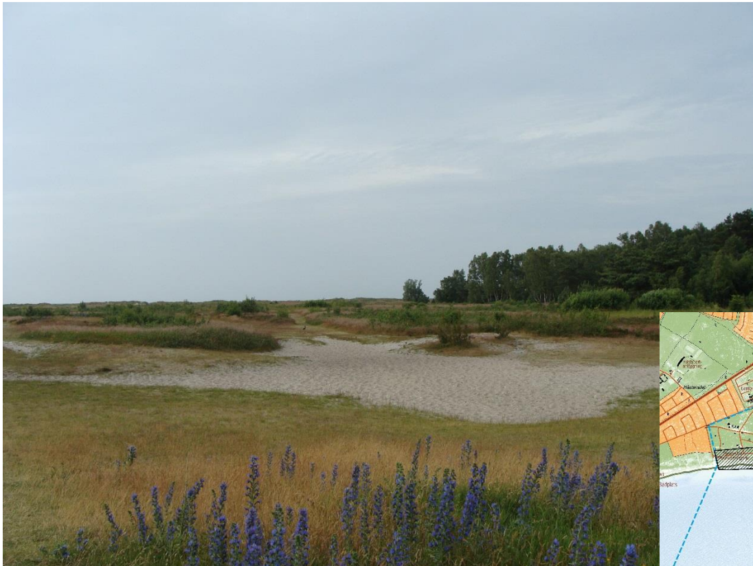
Falsterbo skjutfält